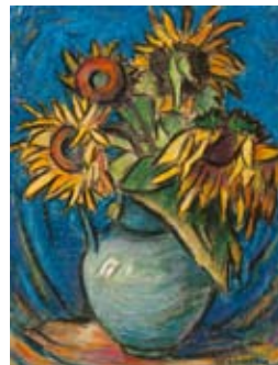
Blumenstilleben, o. D., Ölkreide auf Papier, Stiftung Mecklenburg

positiv dokumentierte. Auch Facklam der vom Verkauf seiner Kunst den Lebensunterhalt seiner Familie sichern musste, versuchte seine bisherigen Bilder der romantischen, von alten Bauernkaten und geschnittenen Kornhocken geprägten mecklenburgischen Landschaft mit Mähdreschern und Neubauernhäusern zu füllen. Eine innere Überzeugung und Zuneigung jedoch, die Facklam zu seinen vorherigen Landschaftsmotiven empfunden hatte und die seine Werke sichtbar geprägt hatten, blieben in diesen neuen Bildthemen aus. Darunter litt auch die Qualität der Bilder. Schließlich verließ er 1963 aus gesundheitlichen Gründen seine Heimat und zog nach Winkelhaid bei Nürnberg, wo er befreit von der politischen Lenkung seiner Werke noch einmal einen Aufschwung in seinem künstlerischen Schaffen erlebte, bevor er am 21. September 1972 verstarb.