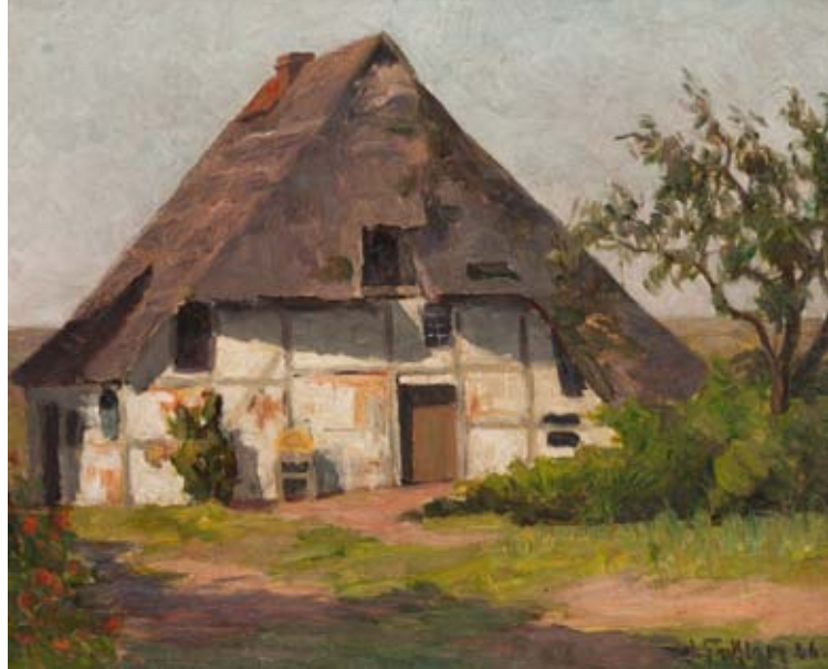
Strohkatze in Upahl, 1926, Öl auf Pappe, Stiftung Mecklenburg

Aufmerksamkeit legten die Künstler dabei auf das Festhalten der unterschiedlichen Lichtstimmungen zu verschiedenen Tageszeiten und Wetterbedingungen in der Natur, oder die Veränderungen, die durch den Wechsel der Jahreszeiten mit der einfachen Landschaft einhergingen. Dieses Interesse hat auch in Facklams Bildern sichtbar Eingang gefunden, was man an seinen Landschaftsmotiven, wie sommerlichen Kornfeldern, Gewittern im Herbst, Märzstimmungen oder Abendlichtszenen nachvollziehen kann.