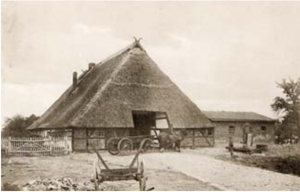
Geburtshaus in Upahl, 1909, Foto: Privat

Bei der Stiftung Mecklenburg ist ein Teil von Facklams umfangreichem Werk überliefert, der nun erstmalig im Schweriner Schleswig-Holstein-Haus in einer Personalausstellung zum Künstler gezeigt wird. Präsentiert werden neben zahlreichen Malereien auch Zeichnungen mit Bleistift, Kohle oder Pastellkreide. Auch die Person des Malers findet in der Ausstellung Berücksichtigung, sowie dessen Leben und Arbeiten in einer Zeit, die von politischen Systembrüchen und radikalisierten Ideologien, von Wirtschaftskrisen und Weltkriegen geprägt war. Trotz dieser widrigen Umstände gelang es dem Maler mit seiner hohen Sensibilität für die Qualitäten der heimatlichen Natur jedoch, durch seine Werke ein aussagekräftiges Bild von der Schönheit der mecklenburgischen Landschaft zu erschaffen. Der Betrachter wird dazu verleitet, mit neuem Interesse in eine ihm vertraute Umgebung zu schauen.