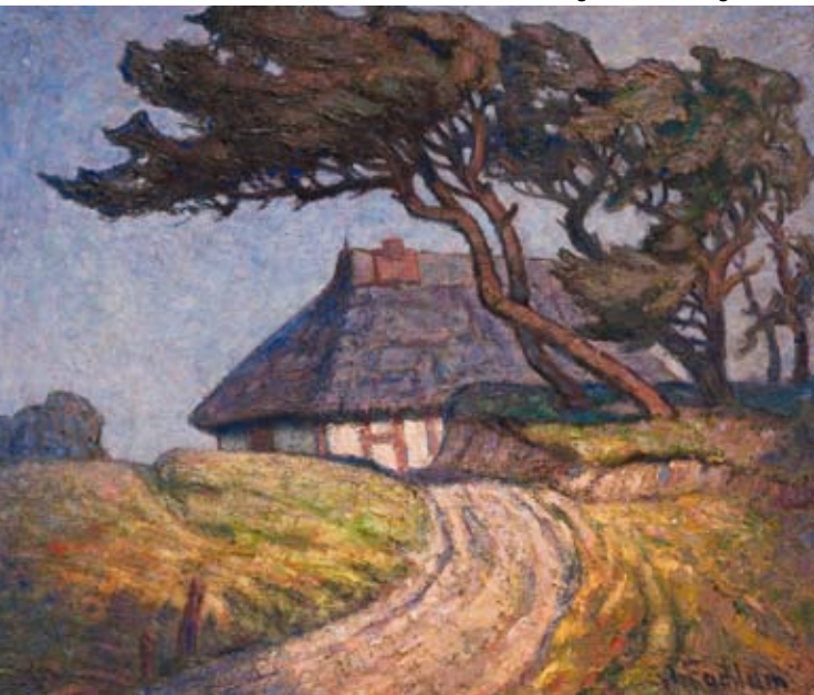
Hinter der Düne , o. D., Öl auf Leinwand, Stiftung Mecklenburg

Auch das sommerliche Kornfeld war ein geliebtes Thema Wilhelm Facklams. Die unzähligen, variierten Ansichten, die das üppige Korn kurz vor der Ernte in seiner goldenen Pracht oder nach dem Schnitt zusammengelegt in Hocken zeigen, zeugen von dieser großen Vorliebe. Sommerliche Mittagshitze oder ruhige Abendstimmungen begleiten diese typisch mecklenburgische Szenerie, die Facklam intensiv