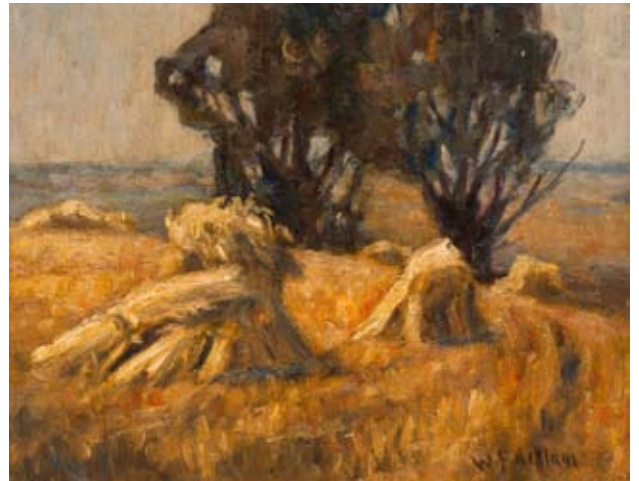
Hocken vor Pappeln, o. D., Öl auf Hartfaserplatte, Stiftung Mecklenburg

positiv dokumentierte. Auch Facklam der vom Verkauf seiner Kunst den Lebensunterhalt seiner Familie sichern musste, versuchte seine bisherigen Bilder der romantischen, von alten Bauernkaten und geschnittenen Kornhocken geprägten mecklenburgischen Landschaft mit Mähdreschern und Neubauernhäusern zu füllen. Eine innere Überzeugung und Zuneigung jedoch, die Facklam zu seinen vorherigen Landschaftsmotiven empfunden hatte und die seine Werke sichtbar geprägt hatten, blieben in diesen neuen Bildthemen aus. Darunter litt auch die Qualität der Bilder. Schließlich verließ er 1963 aus gesundheitlichen Gründen seine Heimat und zog nach Winkelhaid bei Nürnberg, wo er befreit von der politischen Lenkung seiner Werke noch einmal einen Aufschwung in seinem künstlerischen Schaffen erlebte, bevor er am 21. September 1972 verstarb.