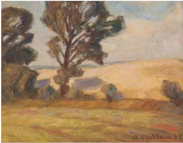
Wilhelm Facklam, Sommertag , 1962, Öl auf Hartfaserplatte, Stiftung Mecklenburg

Auch das sommerliche Kornfeld war ein geliebtes Thema Wilhelm Facklams. Die unzähligen, variierten Ansichten, die das üppige Korn kurz vor der Ernte in seiner goldenen Pracht oder nach dem Schnitt zusammengelegt in Hocken zeigen, zeugen von dieser großen Vorliebe. Sommerliche Mittagshitze oder ruhige Abendstimmungen begleiten diese typisch mecklenburgische Szenerie, die Facklam intensiv