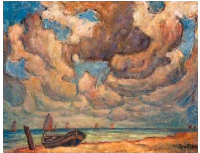
Wolken über der Ostsee , o. D., Öl auf Leinwand, Stiftung Mecklenburg

studierte und immer wieder darstellte, sodass er es bald verstand, seine ganz eigene, meisterhafte Formensprache für dieses Motiv zu entwickeln.