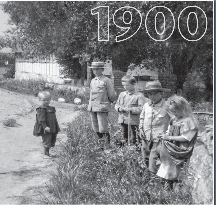
Kinder auf der Dorfstraße in Mamerow bei Teterow